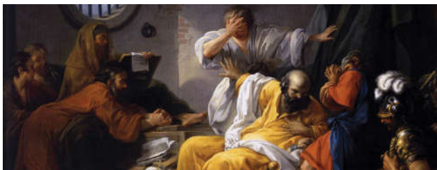
โสกราตีส (Socrates)

รายงานฉบับนี้จัดทำขึ้นโดยข้อมูลเท่าที่ปรากฏและเชื่อว่าเป็นที่น่าเชื่อถือได้แต่ไม่ถือเป็นการยืนยันความถูกต้องและความสมบูรณ์ของข้อมูลสุ่มใดๆ โดยบริษัทหลักทรัพย์ ยูเอบี เคย์ เอเชียน (ประเทศไทย) จำกัด (มหาชน) ผู้จัดทำขอสงวนสิทธิ์ในการเปลี่ยนแปลงความเห็นหรือประมาณการที่ปรากฏในรายงานฉบับนี้ โดยไม่ต้องแจ้งล่วงหน้า รายงานฉบับนี้มีวัตถุประสงค์เพื่อใช้ประกอบการตัดสินใจของนักลงทุน โดยไม่ได้เป็นการชี้นำชักชวนให้นักลงทุนทำการซื้อหรือขายหลักทรัพย์ หรือตราสารทางการเงินใดๆ ที่ปรากฏในรายงาน